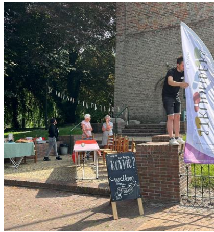
Opbouwen tijdens de garagesale: koffie en thee bij de kerk