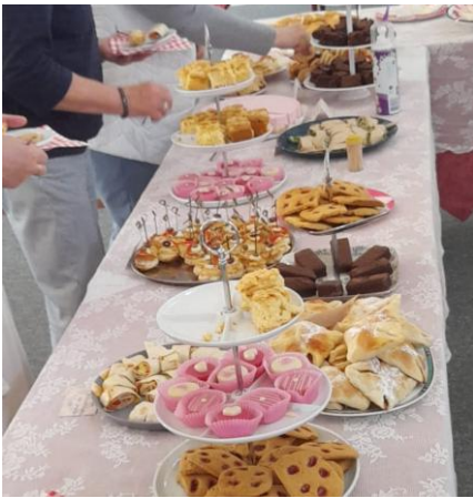
De bingo met Stichting Present was wederom een succes