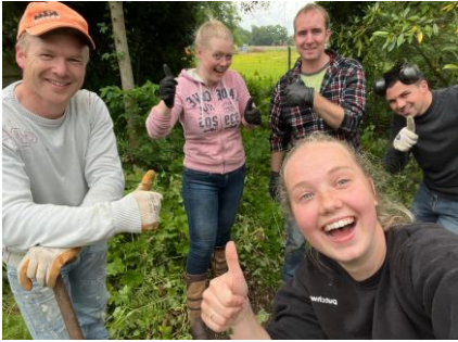
De Struunders in actie! Tuinproject in Hellum via Stichting Present