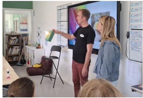
Struunder Gerco toont een lopend vuurtje tijdens Strunen op school over Pinksteren