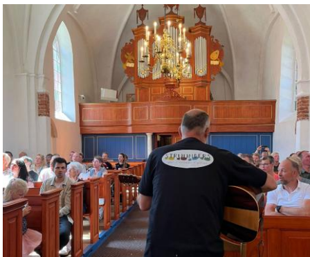
Afsluitend samen zingen tijdens de open dag op 18 mei